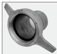
nasady 2 szt.

W komplecie wraz z każdą motopompą otrzymają Państwo: