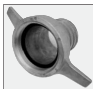
nasady 2 szt.