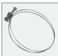
opaski zaciskowe 3 szt.