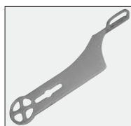
klucz do korpusu