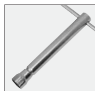
klucz do świecy